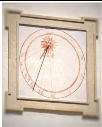
Casa de la Vila

Seguint aquesta ruta, de tradició i saviesa popular, seguireu les hores que pintaren els nostres avantpassats!