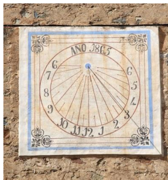
Parròquia de Sant Pere