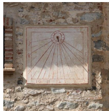
Ermite de Sant Antoni